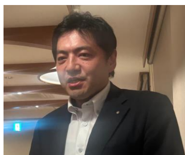
新入会員(入会 3 年未満)歓迎会