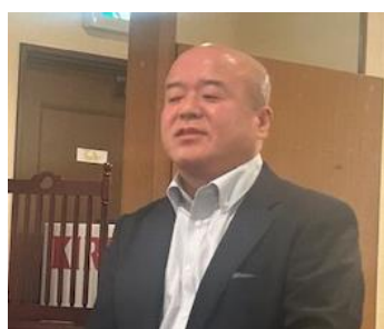
新入会員(入会 3 年未満)歓迎会