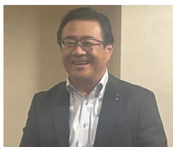
新入会員(入会 3 年未満)歓迎会