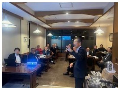
CLF ラーニングセミナーの報告