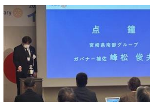
点鐘 峰松ガバナー補佐