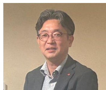
新入会員(入会 3 年未満)歓迎会