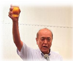
エレクトの乾杯の音頭