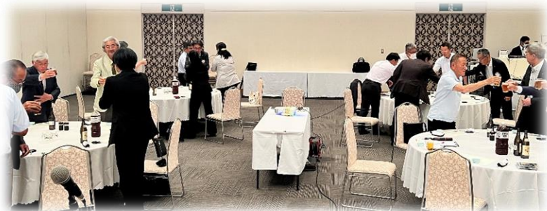
さあ呑みましょう