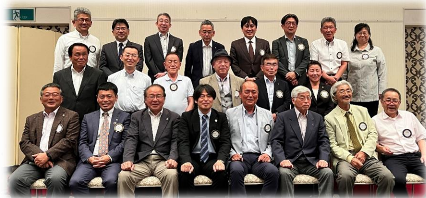
さあみんな笑顔でチーズ